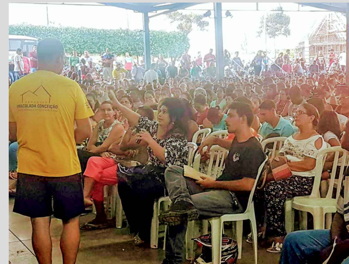
(6) - Participante da cooperativa habitacional “Associação Bom Pastor”, expõe as necessidades da cidade conforme suas expectativas.