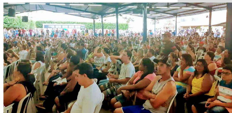
(5) - Reunião temática participativa com a comunidade de Catanduva e Cooperativa Habitacional Bom Pastor.