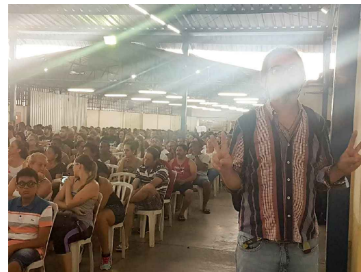
(3) - Participante da cooperativa habitacional “Associação Bom Pastor”, expõe as necessidades da cidade conforme suas expectativas.