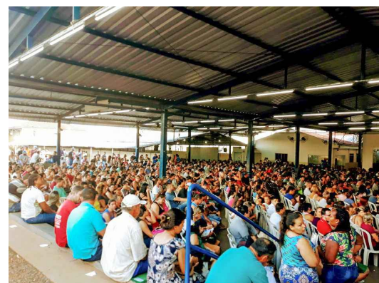
(4) - Reunião temática participativa com a comunidade de Catanduva e Cooperativa Habitacional Bom Pastor.