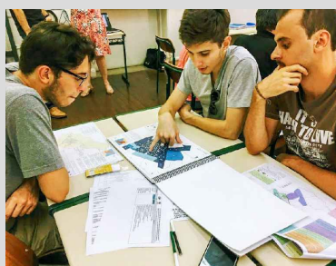
(9 - esquerda) - Representantes dos territórios em discussão de problemas e soluções em reunião temática participativa.