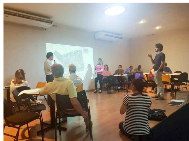
(3) - Representantes do COMDU e NGPD apresentando problemas e soluções em reunião temática participativa.