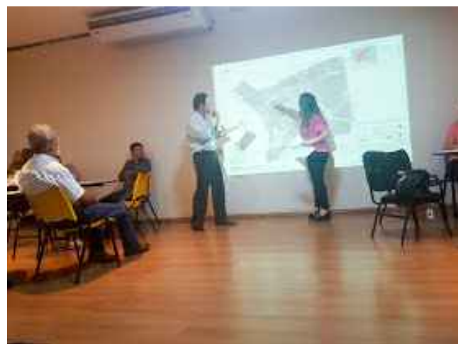
(4) - Representantes do COMDU e NGPD apresentando problemas e soluções em reunião temática participativa.