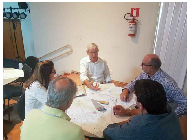
(6) - Representantes do COMDU e NGPD discutindo problemas e soluções em reunião temática participativa.