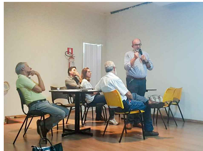
(5) - Representantes do COMDU e NGPD apresentando problemas e soluções em reunião temática participativa.