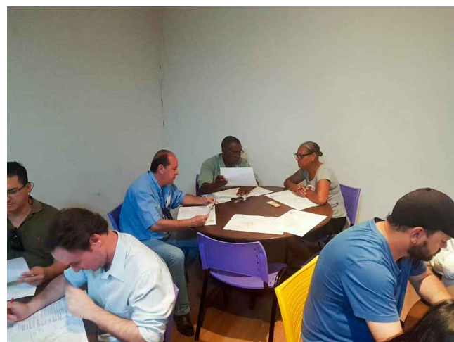
(2) - Representantes do COMDU e NGPD em reunião temática participativa