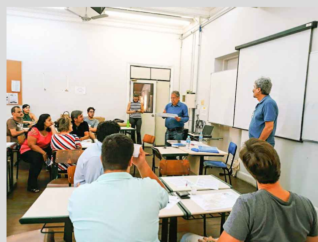
(10 - abaixo) - Representante de território apresentando a discussão feita em grupo, de problemas e soluções para Catanduva, em reunião temática participativa.

Inserção do Município de Catanduva nas UGRHI 15 e 16