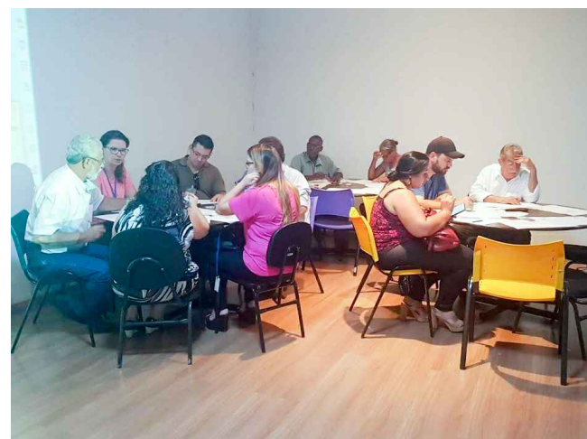
(1) - Representantes do COMDU e NGPD em reunião temática participativa

CMDU e Núcleo Gestor 06 de Novembro de 2018