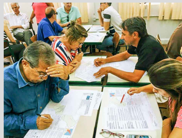
(7 - acima) - Representantes dos territórios em discussão de problemas e soluções em reunião temática participativa.