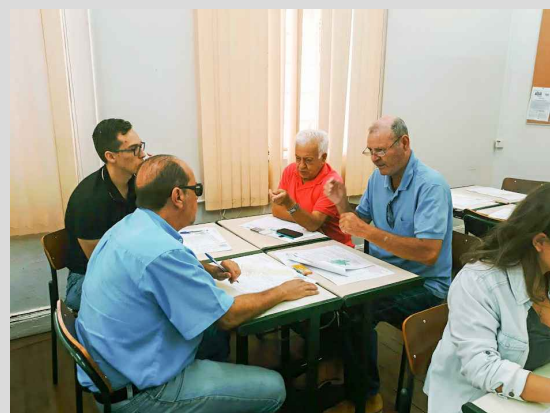
(9) - Representantes dos territórios em reunião temática participativa.