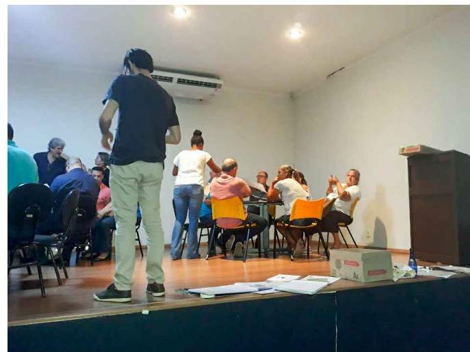
(4) - Representantes do COMDU e Nucleo gestor, em grupos discutindo as temáticas da reunião.