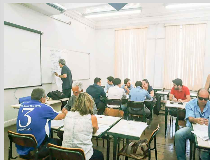
(5) - Representantes dos territórios em reunião temática participativa.