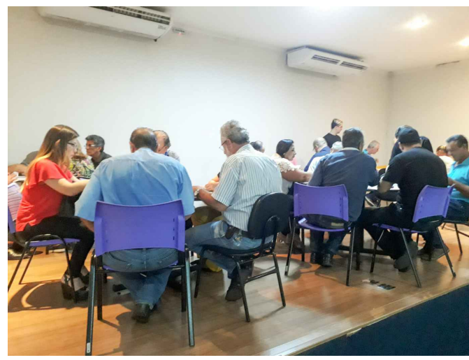
(2) - Representantes do COMDU e Nucleo gestor, em grupos discutindo as temáticas da reunião.