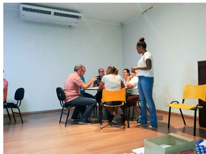
(1) - Representantes do COMDU e Nucleo gestor, em grupos discutindo as temáticas da reunião.

CMDU e Núcleo Gestor - 30 de Outubro de 2018