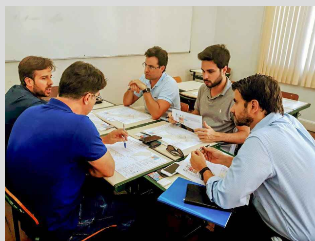
(7) - Representantes dos territórios de Catanduva, em grupos discutindo a temática da reunião.