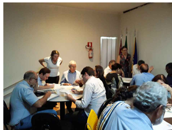
(1) - Representantes do COMDU e Nucleo gestor, em grupos discutindo as temáticas da reunião.

Destas reuniões, guardou-se os apontamentos dos representantes e todas as propostas foram compiladas em mapas que podem ser vistos neste caderno chamado AUCA 02.