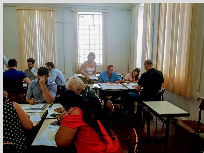
(4) - Representantes dos territórios de Catanduva, em grupos discutindo a temática da reunião.