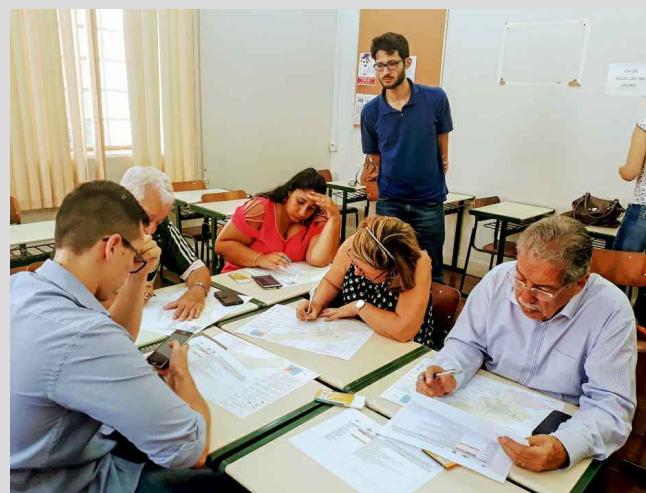
(6) - Representantes dos territórios de Catanduva, em grupos discutindo a temática da reunião.