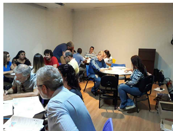
(2) - Representantes do COMDU e Nucleo gestor, em grupos discutindo as temáticas da reunião.