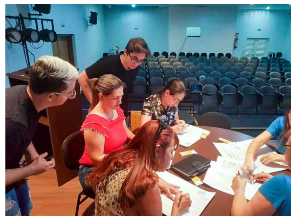
(3) - Grupo de discussão do tema com assessoria da equipe técnica, em atividade.