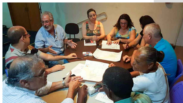
(4) - Representantes do COMDU em grupo discutindo o tema da reunião.