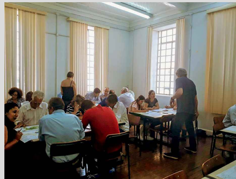
(8) - Representantes dos territórios em grupos discutindo o tema da reunião.