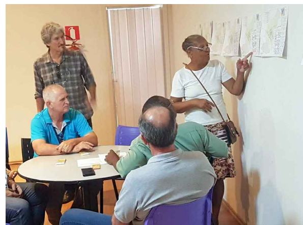
(1) - Representante do COMDU apresentando seus apontamentos

Destas reuniões, guardou-se os apontamentos dos representantes e todas as propostas foram compiladas em mapas que podem ser vistos neste caderno chamado AUCA 02.