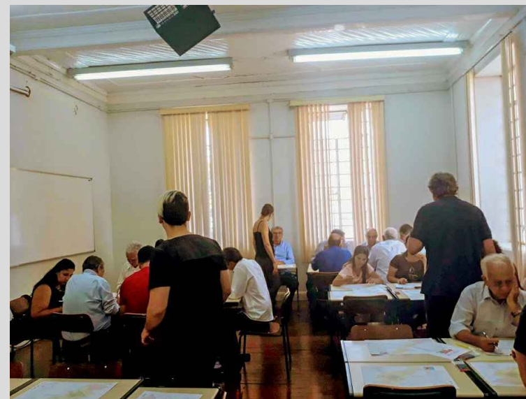
(7) - Representantes dos territórios em grupos discutindo o tema da reunião.