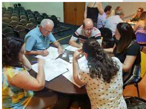
(5) - Grupo de discussão em atividade.