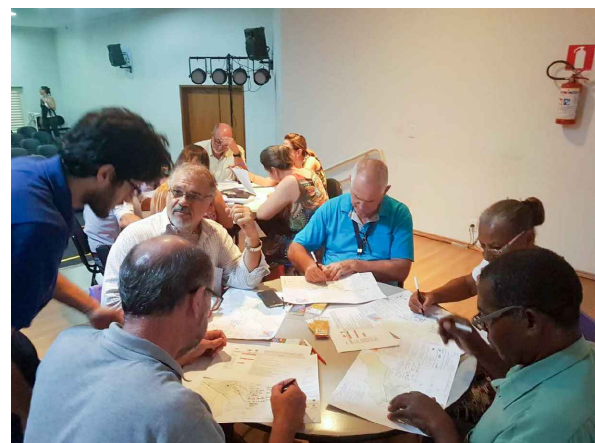
(2) - Grupo de discussão com assessoria da equipe técnica, em atividade.